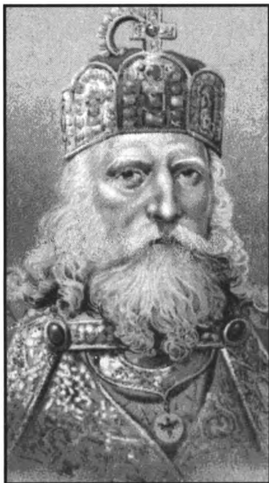
لوحة تجسد صورة شارلمان بهيئته الامبراطورية